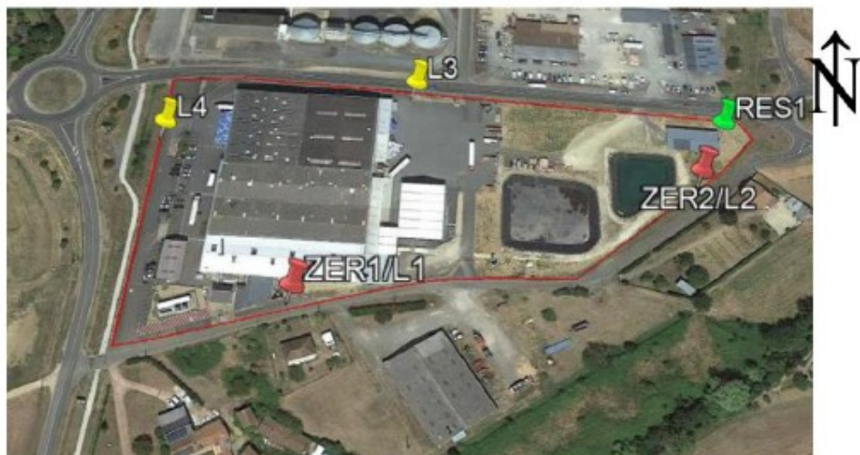
Figure 1. Emplacement des points de mesures